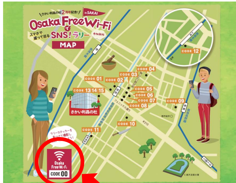
ラリーステッカー (イメージ)