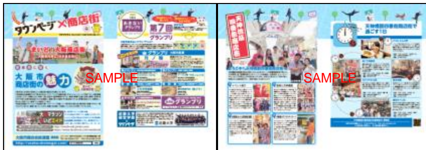
「まいど！大阪商店街特集」の一部

昨年の巻頭に特集として掲載し、利用者アンケートでも好評だった「まいど！大阪商店街特集」を、今回は 近畿大学経営学部とコラボレーション 。学生ならではの視点で「 大阪市内のおもしろい商店街の情報 」をピックアップし、 商店街の取り組みやお店の特徴を掲載しました。