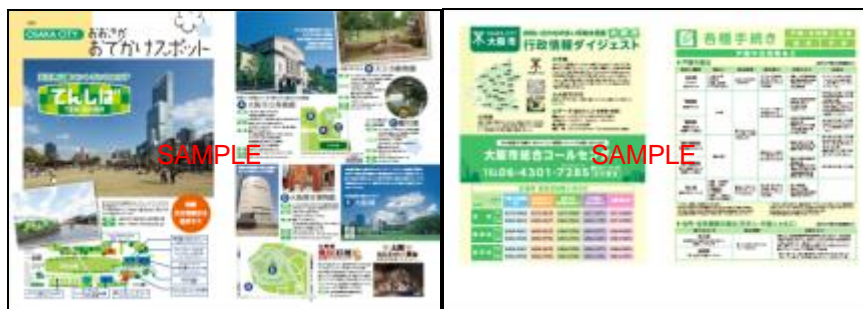
左から、「おおさかお出かけスポット」、「大阪市の行政情報」の一部(大阪市北部版)

大阪市役所、大阪市内各区役所に特に問い合わせの多い内容を、ダイジェスト版として掲載しました。