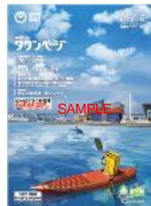
左から、大阪市東部版(大阪城)、大阪市南部版(天王寺公園)、大阪市西部版(天保山ハーバービレッジ)「タウンページ」の表紙