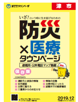
別冊「防災×医療タウンページ」