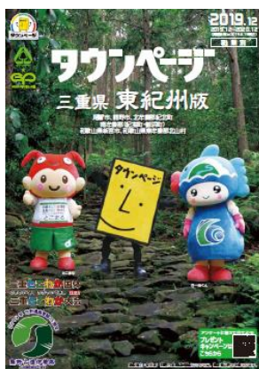
三重県東紀州版「タウンページ」