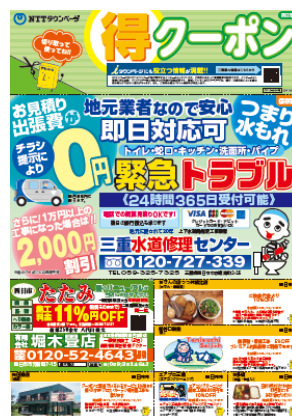
「クーポンチラシ」四日市市版