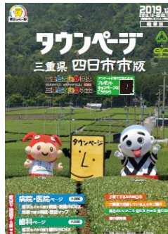
三重県四日市市版