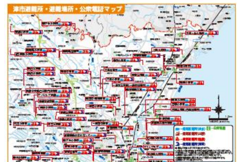
避難所・公衆電話マップ