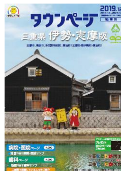
三重県伊勢・志摩版