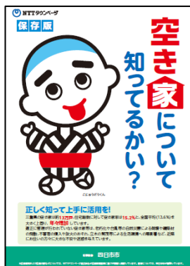
「空き家対策チラシ」四日市市版

また、暮らしのお困りごと解決や、グルメに関するお得情報を掲載した地域密着型のクーポンチラシも発行しました。