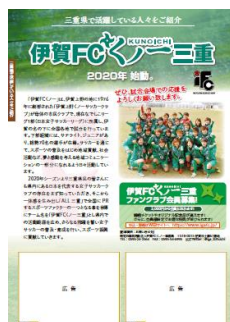
三重県で活躍している人々をご紹介