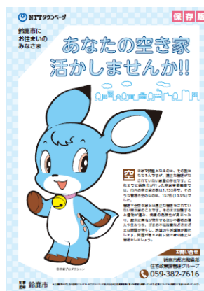
「空き家対策チラシ」鈴鹿市版