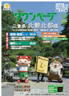
三重県北勢北部版

各行政機関と連携し、地域住民ならご存じの観光スポットや名所で地元キャラクターとタウンページ君に加え、2021年に開催する「三重とこわか国体」「三重とこわか大会」のマスコットキャラクターである「とこまる」も撮影に参加し、多くの県民の皆さまに親しみを持ちご利用いただけるように企画・編集しました。