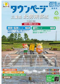
三重県北勢南部版