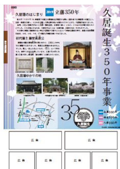
津市「久居誕生 350 年」事業