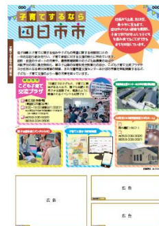
子育てするなら四日市市