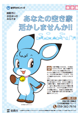
「空き家対策チラシ」鈴鹿市版