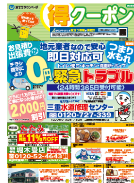
「クーポンチラシ」四日市市版