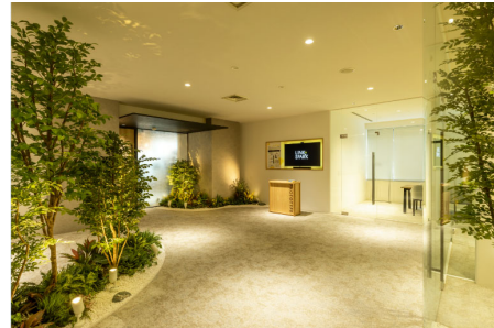
PUBLIC SPACE (交流)