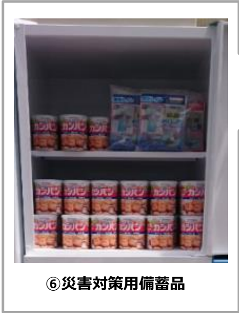
⑥ 災害対策用備蓄品