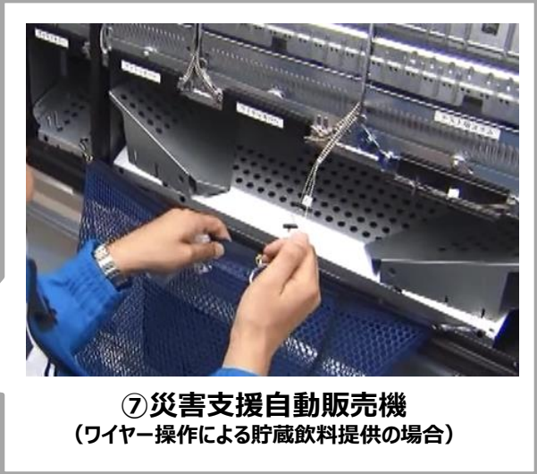
⑦ 災害支援自動販売機 (ワイヤー操作による貯蔵飲料提供の場合)