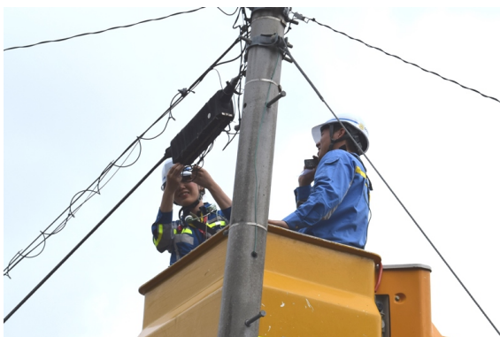
※一軒一軒の故障修理（鹿児島市）