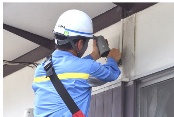
※引込線の故障修理（鹿児島市）