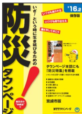
別冊「防災タウンページ」