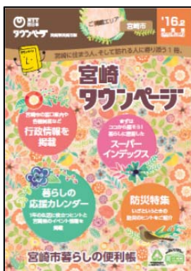
宮崎県宮崎市版「タウンページ」

宮崎市の協力のもと、 宮崎市内の避難所情報や防災情報提供サービスも掲載 。また、 日々の備えから発災後のサポートに活用できるコンテンツ(安否確認の方法・災害への備え・応急手当の方法・災害の後始末) をまとめました。さらに、避難所だけでなく、携帯電話の電源が切れた場合を想定し、 公衆電話(屋外)の設置場所 を掲載するなど、充実した情報量となっております。