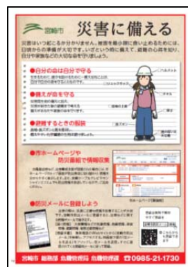
防災情報メール配信等