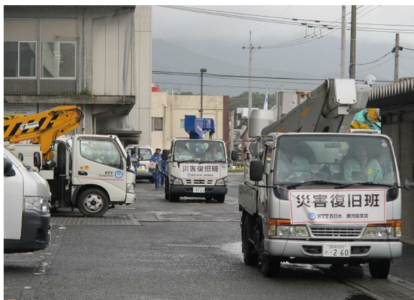
出動する災害復旧班 (鹿屋市)