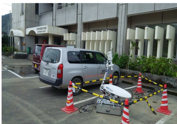
ポータブル衛星通信を用いた特設電話設置 (垂水市二川公民館)