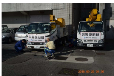
災害復旧活動（鹿屋）