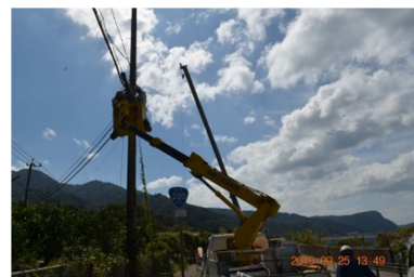
架空ケーブル復旧作業（鹿屋）