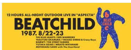
スポーツタオル(5名様)