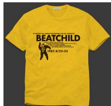
オリジナルTシャツ(5名様)