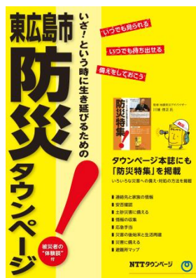
別冊「防災タウンページ」