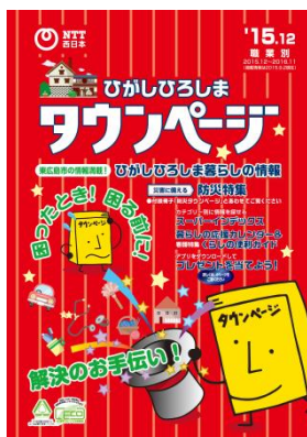
東広島市版「タウンページ」

東広島市の協力のもと、 東広島市内の避難所情報や防災情報提供サービスも掲載 。また、 日々の備えから発災後のサポートに活用できるコンテンツ(安否確認の方法・災害への備え・応急手当の方法・災害の後始末) をまとめました。さらに、避難所だけでなく、携帯電話の電源が切れた場合を想定し、 公衆電話(屋外)の設置場所 を掲載するなど、充実した情報量となっております。