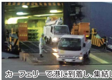
カーフェリーで港に到着し、集結した高所作業車