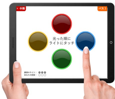
サービスイメージ

2022 年 3 月より、NTT 西日本グループの NTT ビジネスソリューションズ株式会社にて、「CogEvo (コグエボ) ®」の取次販売を開始しています。