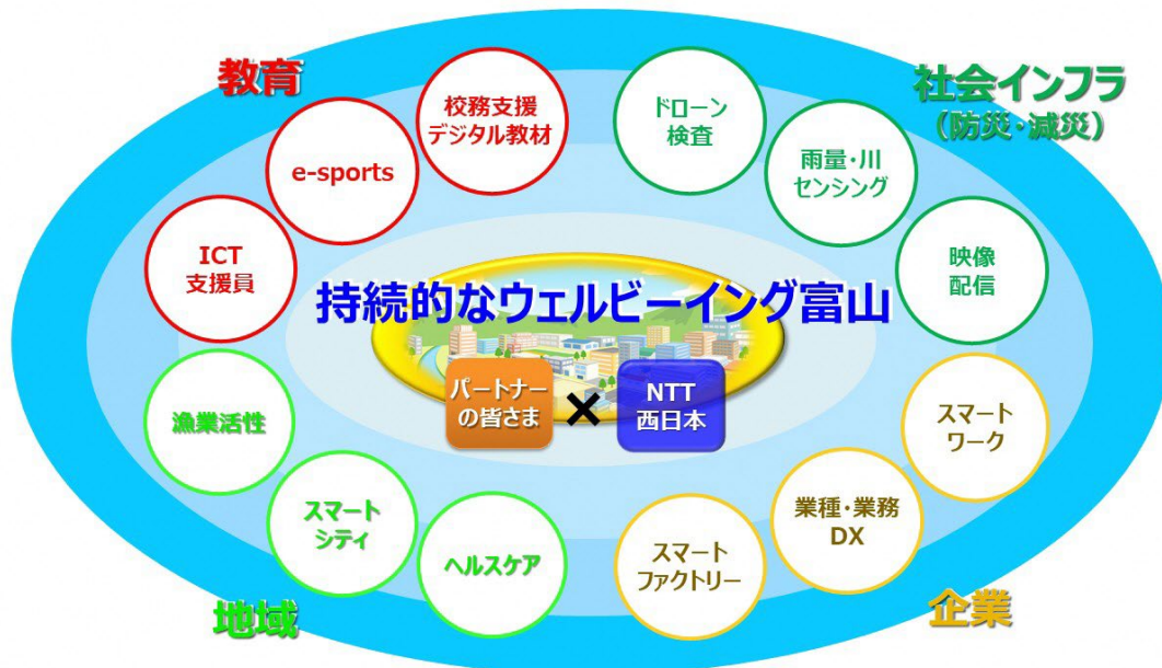
【ウェルビーイング社会の実現へ向けた取り組みイメージ】

本取り組みを通じて、高齢者における「コミュニケーション活性化」「健康増進」の一助を担いたい考えです。