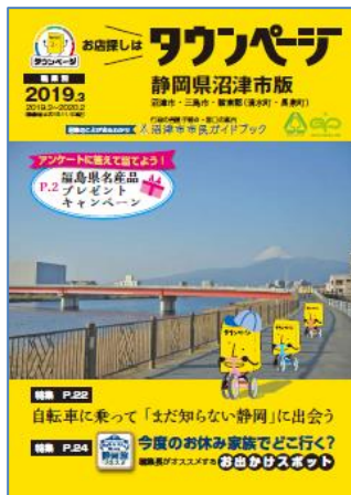
静岡県沼津市版タウンページ