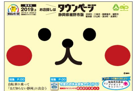
静岡県裾野市版タウンページ