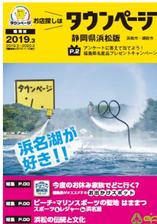
静岡県浜松版タウンページ