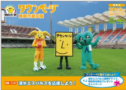
静岡市葵区版タウンページ