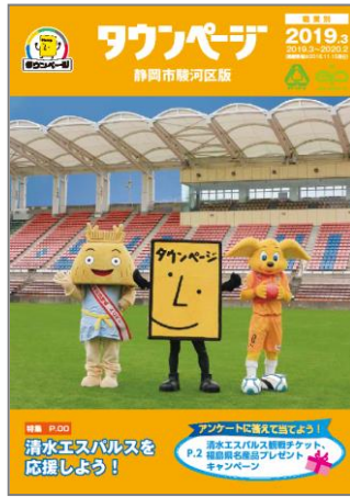
静岡市駿河区版タウンページ