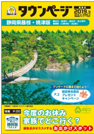
静岡県藤枝・焼津版タウンページ