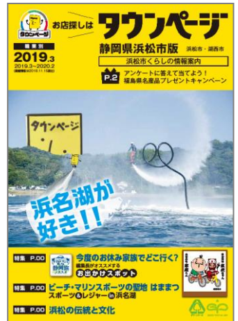
静岡県浜松市版タウンページ