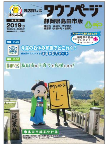
静岡県島田市版タウンページ