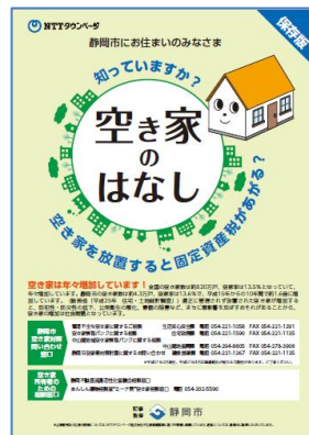
「空き家対策チラシ」（表紙）