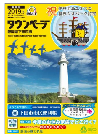
静岡県下田市版タウンページ