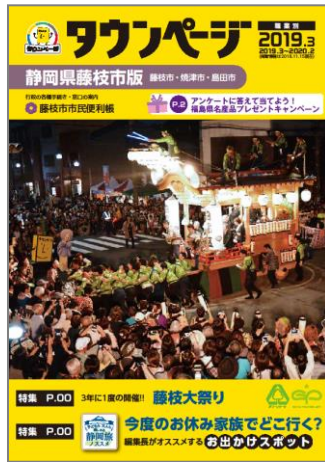
静岡県藤枝市版タウンページ