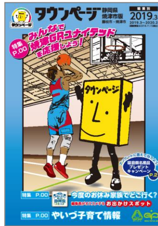
静岡県焼津市版タウンページ