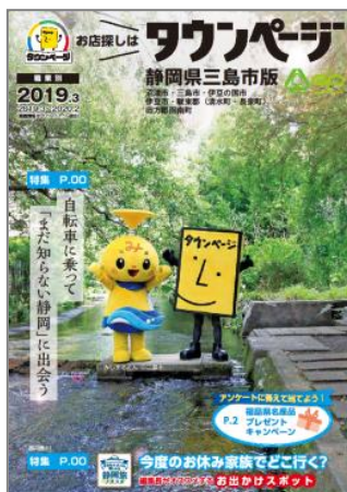
静岡県三島市版タウンページ