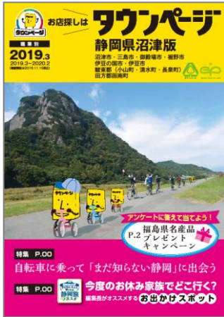
静岡県沼津版タウンページ