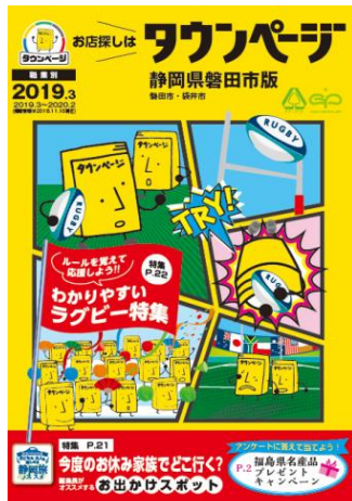
静岡県磐田市版タウンページ