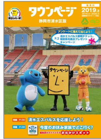
静岡市清水区版タウンページ