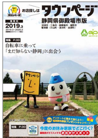
静岡県御殿場市版タウンページ