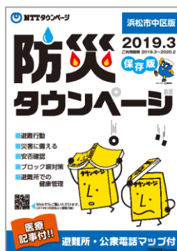
別冊「防災タウンページ」