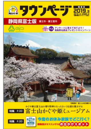
静岡県富士版タウンページ (富士宮市)