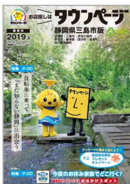
静岡県三島市版タウンページ