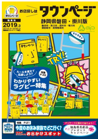
静岡県磐田・掛川版タウンページ