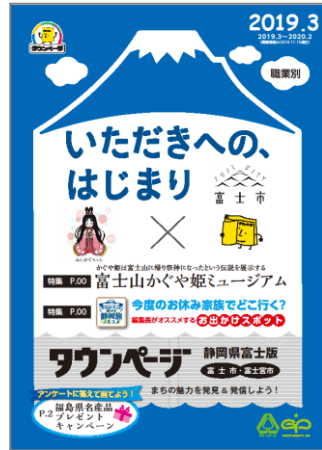
静岡県富士版タウンページ (富士市)