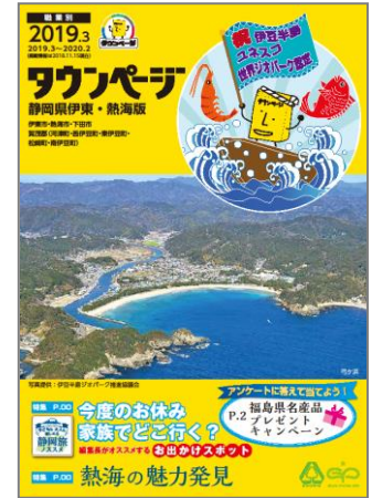
静岡県伊東・熱海版タウンページ