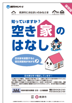
空き家対策チラシ