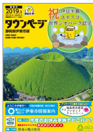
静岡県伊東市版タウンページ