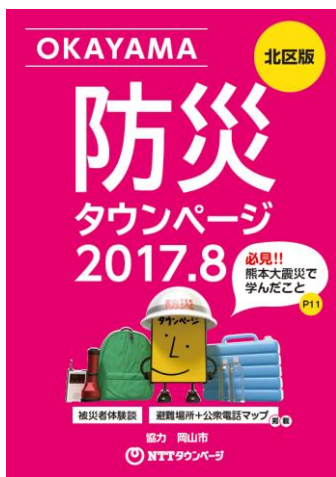
別冊「防災タウンページ」（岡山市版）表紙

岡山市のご協力もいただき、避難所情報や岡山市の緊急情報の取得方法も掲載。実際に被災された方の体験談なども掲載し、災害発生時に本当に困ったこと・準備が必要だった物などの情報も知ることができます。また、避難場所だけでなく、携帯電話の電源が切れた場合を想定し、公衆電話（屋外）の設置場所も掲載するなど、充実したつくりになっております。