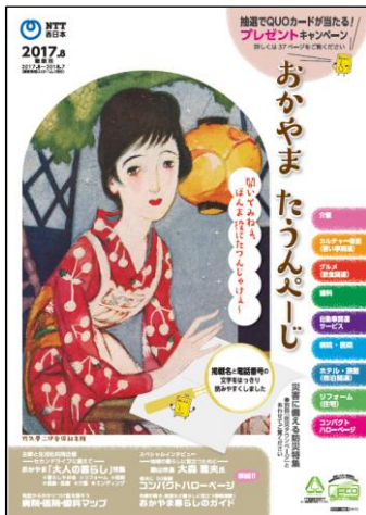
「おかやまタウンページ」表紙