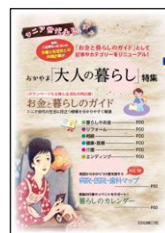
「大人の暮らし特集」表紙

シニア世代の生活にこれまで以上にお役に立てるよう、 昨年掲載した「セカンドライフ特集」の記事やカテゴリーを 見直し。ライフステージごとに「暮らしやお金」、「リフォーム」、 「相続」、「健康・医療」、「介護」、「エンディング」の6つの カテゴリーに分類し、役立つ情報を「お金と暮らしのガイド」 としてわかりやすく掲載しました。また、地図から医療機関を 探せる「病院・医院・歯科マップ」も新たに掲載しました。