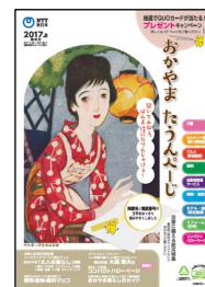
「おかやまタウンページ」表紙

表紙デザインには、岡山県出身の画家、竹久夢二の美人画の写真を使用し、地元の方にもより親しみやすく誇りの持てるものにしました。