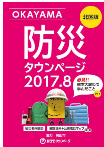
別冊「防災タウンページ」 （岡山市版）表紙