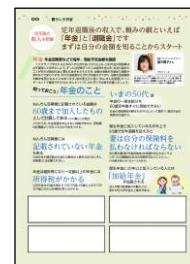
「お金と暮らしのガイド」