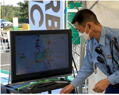
(選手の位置を確認する様子)