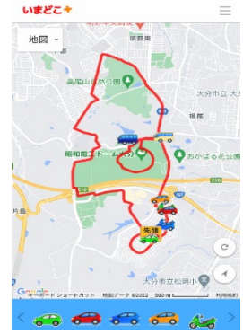
(レースの見える化イメージ)

また、NTT 西日本 大分支店は、「OITA サイクルフェス」公式 YouTube で、出場選手及びスタッフへ応援メッセージを贈り大会を盛り上げました。