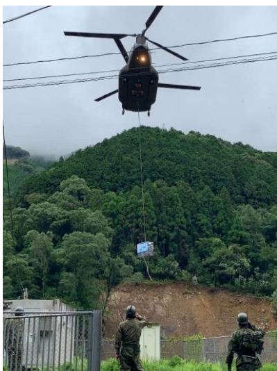
自衛隊ヘリによる通信ビル用発動発電機の搬送