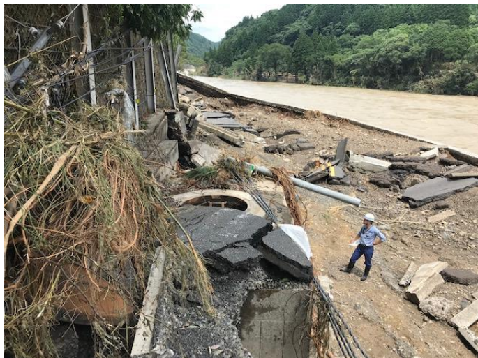
道路崩落によるケーブル切断(熊本県球磨村)