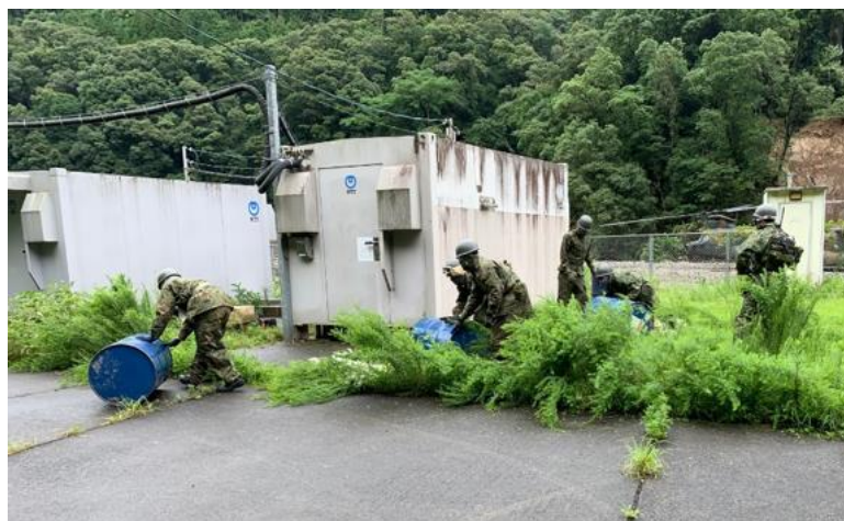
発動発電機用燃料等の運搬