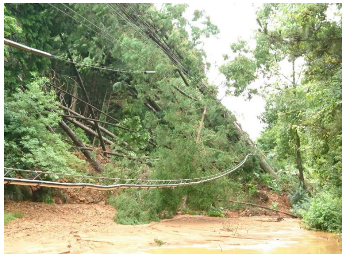
土砂崩れによる電柱倒壊・通信ケーブル切断(熊本県芦北町)