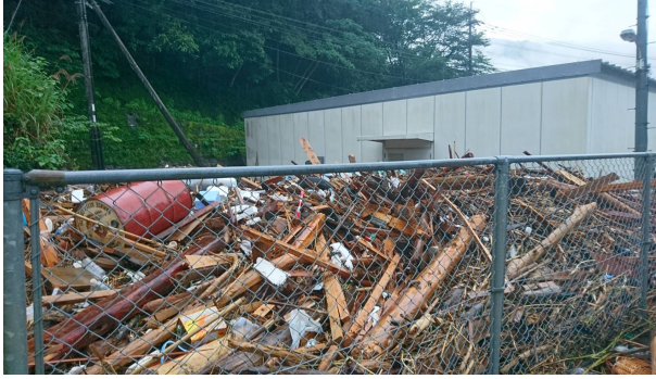
←土砂が流入したと想定される熊本県八代市の通信ビル(NTT坂本ビル)