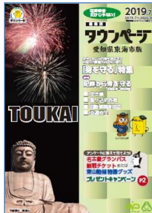
愛知県東海市版タウンページ