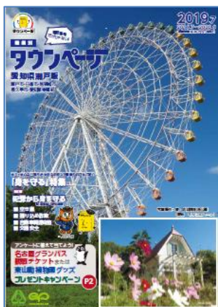
愛知県瀬戸版タウンページ