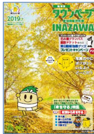
愛知県稲沢市版タウンページ