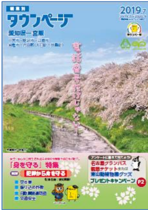
愛知県一宮版タウンページ