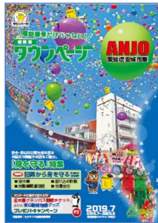
愛知県安城市版タウンページ