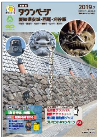
愛知県安城・西尾・刈谷版タウンページ