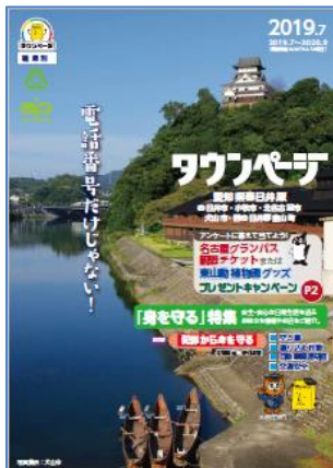
愛知県春日井版タウンページ