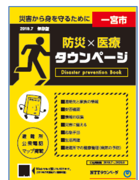
別冊「防災×医療タウンページ」