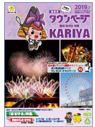
愛知県刈谷市版タウンページ