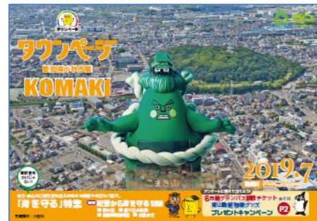
愛知県小牧市版タウンページ