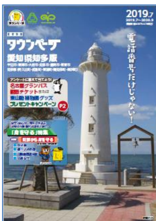
愛知県知多版タウンページ