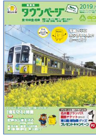
愛知県豊橋版タウンページ