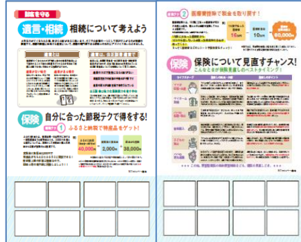
身を守る特集（財産を守る編）