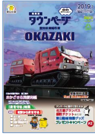
愛知県岡崎市版タウンページ