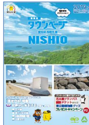
愛知県西尾市版タウンページ