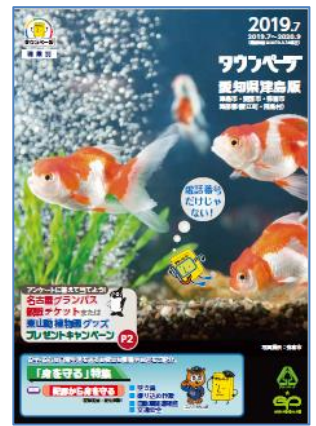
愛知県津島版タウンページ