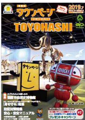
愛知県豊橋市版タウンページ