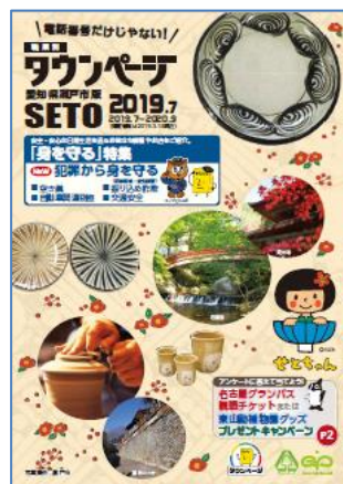
愛知県瀬戸市版タウンページ