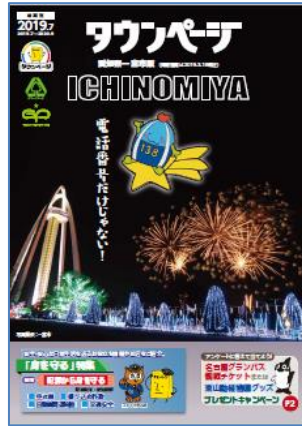
愛知県一宮市版タウンページ