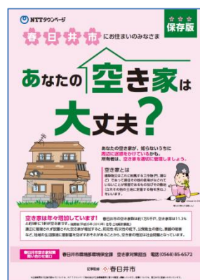
空き家対策チラシ