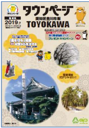
愛知県豊川市版タウンページ