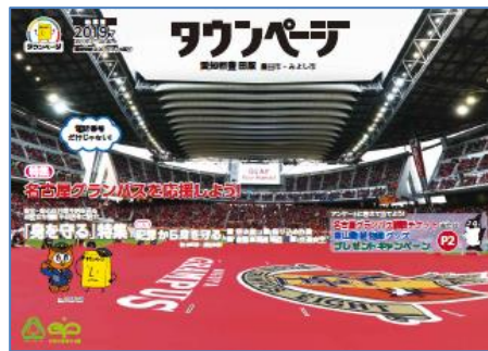
愛知県豊田版タウンページ