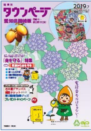
愛知県岡崎版タウンページ