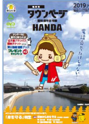
愛知県半田市版タウンページ