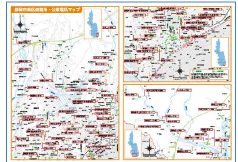
公衆電話・避難所マップ