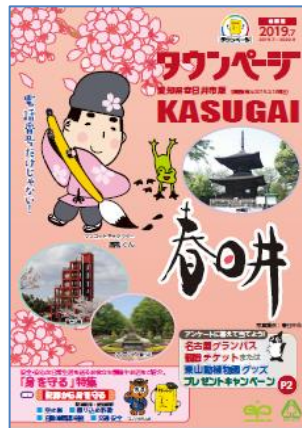
愛知県春日井市版タウンページ