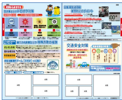
身を守る特集（愛知県警ページ）

また豊橋市版では、豊橋市から今話題のスポットである豊橋市自然史博物館の集客を目的に記事提供をいただき、表紙と連動した地域密着特集を掲載しました。