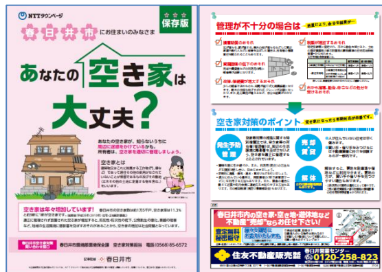
「空き家対策チラシ」(春日井市)