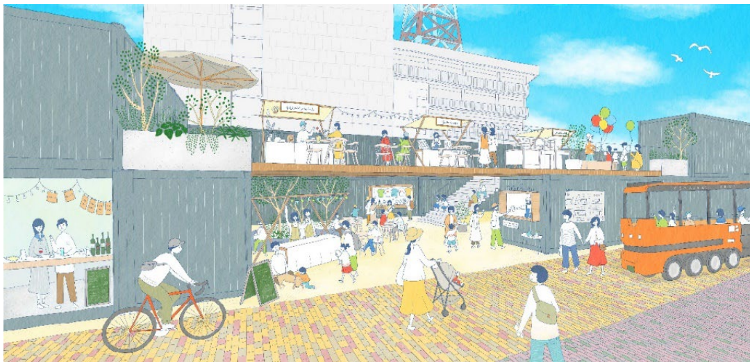
図 2 広島通り側から見た賑わいのイメージパース

具体的には、NTT 局舎として長年地域のみなさまに親しまれている旧 NTT 宮崎支店北棟を、商業（1 階）とオフィス(2~3 階)の複合施設としてリノベーションし 2025 年春開業する予定です。また南棟は、既存建物を撤去し、低層の商業施設を計画します。活気にあふれ、人々が集まりたいような施設として 2024 年秋開業をめざします。