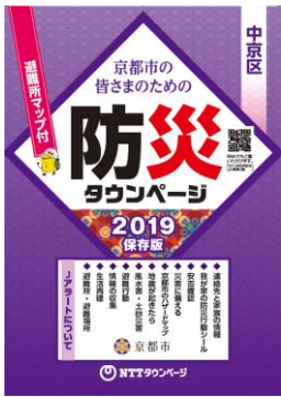
「防災タウンページ京都市中京区版」表紙