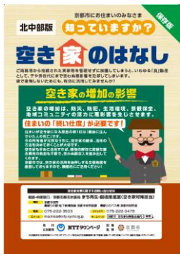
「空き家対策チラシ京都市北中部版」表紙

・京都市都市計画局まち再生・創造推進室（空き家対策担当）にご協力いただき、空き家に関する知識や対策等を掲載しました。