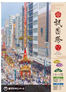
「別冊 京都市版（祇園祭）」表紙

・公益財団法人祇園祭山鉾連合会にご協力をいただき、祇園祭の主な行事、山鉾一覧、祇園祭の楽しみ方、前祭 map、後祭 map など、祇園祭を楽しんでいただくために必要な情報を、コンパクトな B5 版サイズの冊子に掲載しました。