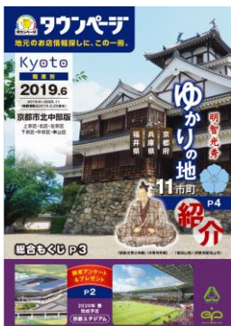
「京都市北中部版タウンページ」表紙