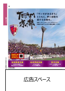
巻頭特集記事「京都サンガ F.C.」