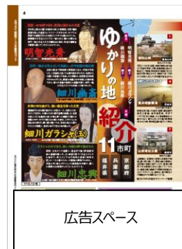
巻頭特集記事「大河ドラマ（麒麟がくる）史跡観光ガイド」