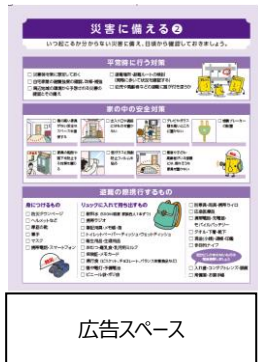
「記事：災害に備える」