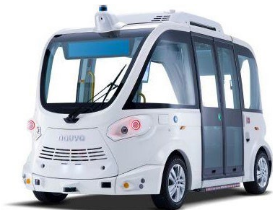
Navya Mobility 社製 EVO 試乗枠の定員: 9 名