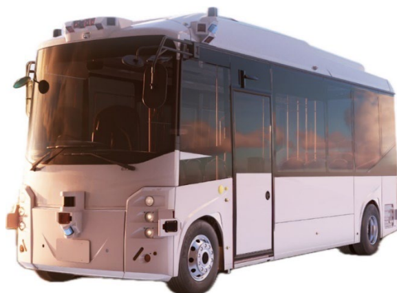
TierIV社製 Minibus 試乗枠の定員: 12 名