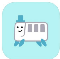
専用アプリ 「バスきて」