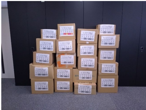
寄贈品（ダンボール20箱相当）

本活動は2020年12月からスタートし、以降、毎年夏と冬の2回、大阪府内のNTT西日本グループ各社にも食品募集の声掛けを行い、今回で8回目となります。なお「社内の防災備蓄食品の寄贈」は2020年から「賞味期限の3カ月前」に、同じく「認定NPO法人ふーどばんく OSAKA」さまへ寄贈しています。