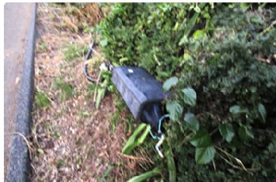
※落下した接続箱（沖永良部島）