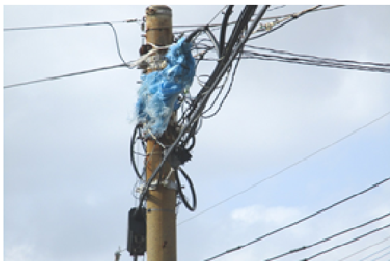
※飛来物によるケーブルの損傷（沖永良部島）