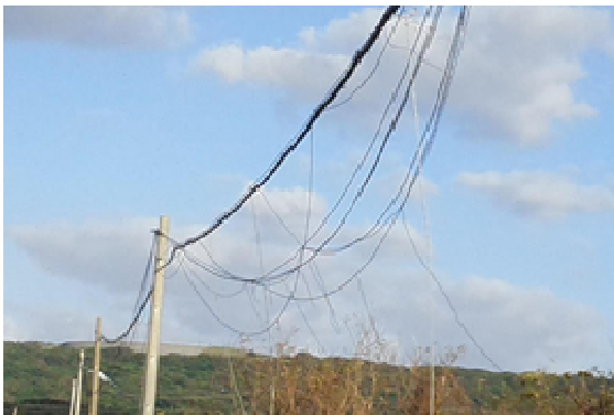
※通信ケーブルの垂れ下がり（喜界島）