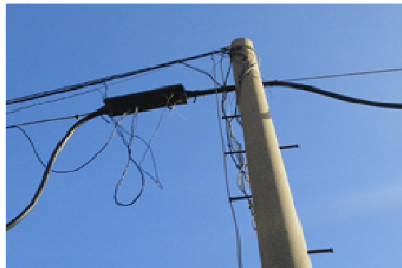
※通信ケーブルの切断（喜界島）