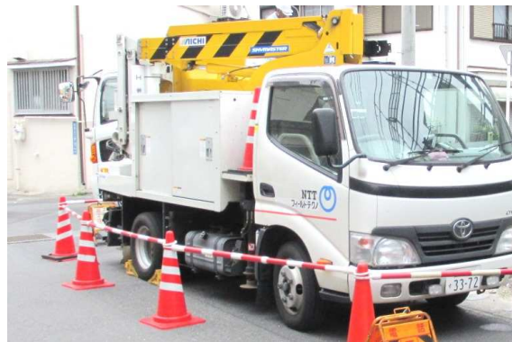
※復旧工事車両（鹿児島市）