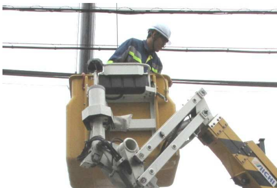
※通信ケーブルの接続作業（鹿児島市）