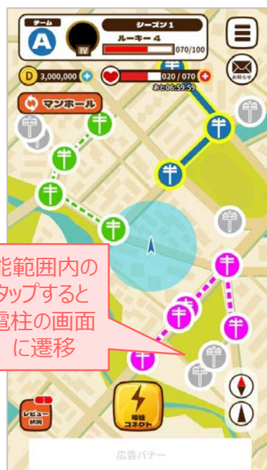
①ゲームトップ画面