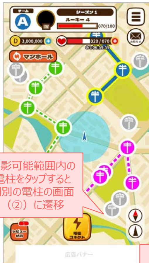
①ゲームトップ画面