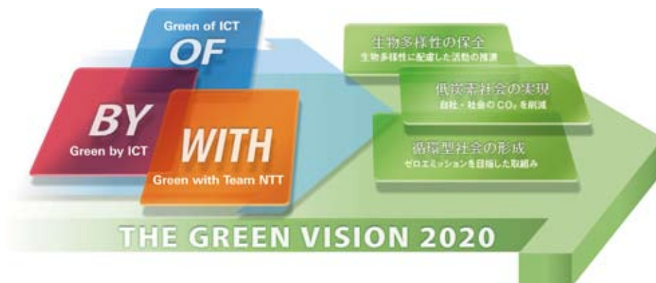
図1 「THE GREEN VISION 2020」イメージ

3つの環境テーマの達成に向けては、「Green of ICT」、「Green by ICT」、「Green with Team NTT」という3つのアクションにより、NTT西日本においても取り組んでいます。