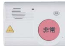
簡易型緊急通報装置の認定商品「シルバーホン あんしんSV」(情報機器)