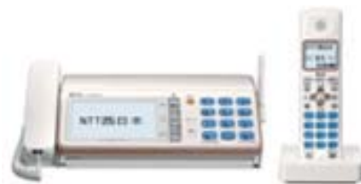
ホームファクスの認定商品「でんえもん268SD」(情報機器)