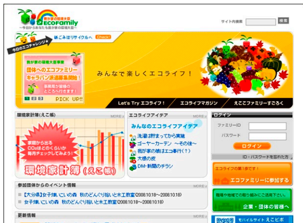
図1 エコファミリートップページ

NTT西日本グループは、「我が家の環境大臣エコファミリー」への団体登録を実施し、各社員、各個人が家庭で楽しみながら省エネ活動に取り組んでいます。