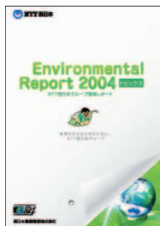
小冊子版(トピックス版)