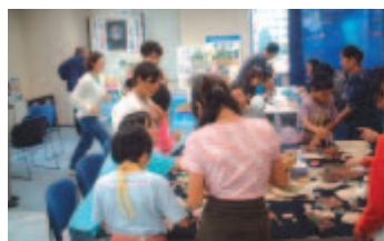
「おうみ市民活動屋台村」

県、市町村の出資により「県民の自主的で営利を目的としない社会的活動を総合的に支援」することを目的に平成9年4月設立。 (財)淡海文化振興財団が運営。