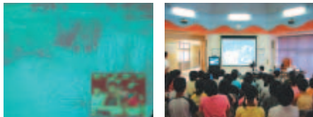
TV会議を利用した学校間交流模様

野帳とは自然を観察するノートのことで、電子化によって、ペン、音声、写真の各入力機能、GPSで位置を見つけるなどの機能を持つ。