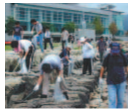
びわ湖クリーンキャンペーン