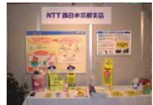
京都環境フェスティバル出展模様