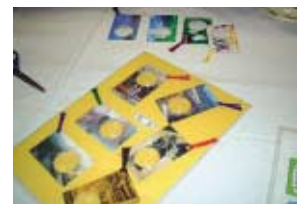
テレホンカードを利用したルーベ