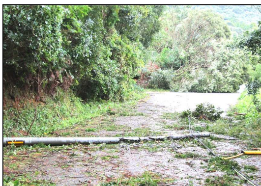
※倒壊した電話柱 (南さつま市)