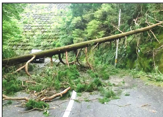
※倒木による通信ケーブル損傷 (南さつま市)