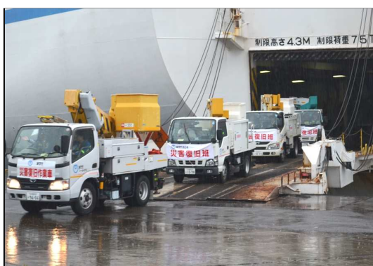
※続々と到着する広域支援 (志布志港)