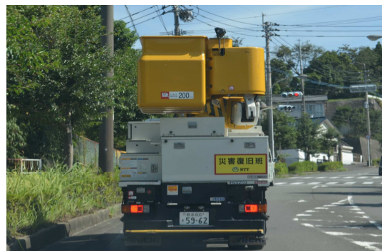
※県外からの支援車両（写真は熊本）