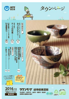
岐阜県東濃版 (写真:美濃焼)