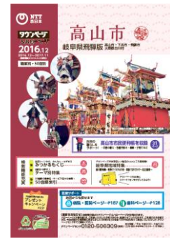
「岐阜県岐阜版(各務原市)表紙」「岐阜県西濃版(大垣市)表紙」「岐阜県飛騨版(高山市)表紙」 (写真:新境川の桜並木) (写真:水都まつりくわん灯流し) (写真:高山市制施行 80 周年記念 高山祭屋臺からくり競演)