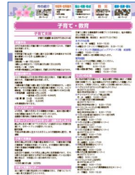
「各種届出のご案内(各務原市)」「生活環境(ごみ)(大垣市)」「子育て・教育(高山市)」