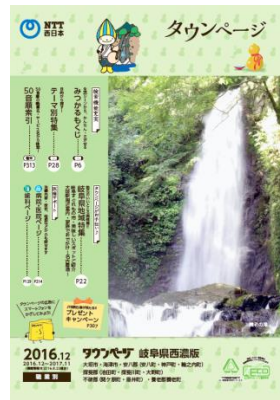
岐阜県西濃版 (写真:養老の滝)