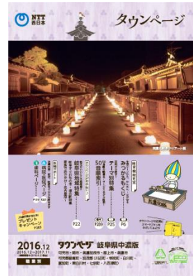
岐阜県中濃版 (写真:美濃和紙あかりアート展)