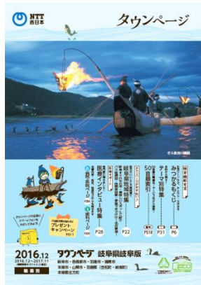
岐阜県岐阜版 (写真:ぎふ長良川鶺鴒)

各エリアの代表的な特産品・名所の写真を表紙全面に、一目で各エリアの情報が掲載されているタウンページとわかるデザインにしました。