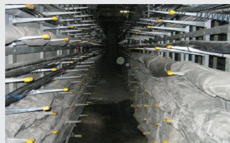
とう道 (通信ケーブル用地下トンネル) 245km