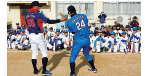
硬式野球部員がバッティングを指導

NTT西日本硬式野球部による小・中学生を対象にした野球教室を2004年より毎年開催しています。2015年度は、西日本エリアで8回開催し、59チーム・771名の参加がありました。