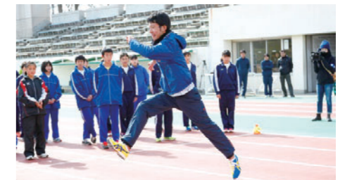
陸上競技部員がランニングフォームを説明

NTT西日本陸上競技部による中学生を対象にした陸上教室で、2008年度より毎年開催しています。大阪府内の中学生7チーム・43名を対象に、上半身・下半身のポイントなどランニングフォームについて理論的に説明、練習方法などを紹介。その後、競技レベルを合わせたチーム編成による駅伝競走を行うなど、子どもたちとのふれあいを深めました。