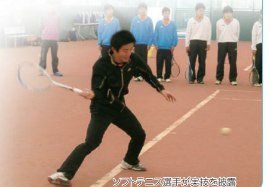
ソフトテニス選手が実技を披露

NTT西日本のソフトテニス選手が、ジュニアチームの選手たち25チーム・208名を対象にソフトテニス教室を行いました。ジュニアチームの選手たちは、トップレベルの選手から学べるという、少しでも技術を吸収しようと熱心に指導を受けていました。