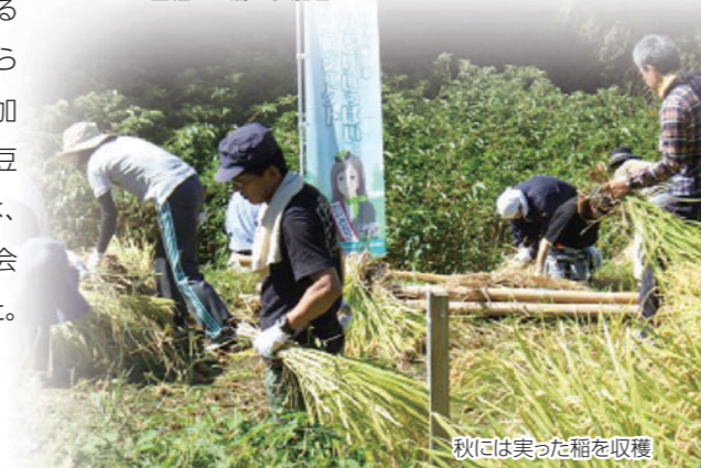
秋には実った稲を収穫