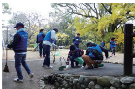
社員以外にもたくさんの関係者が参加