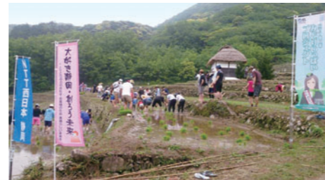
田植えに励む参加者

NTT西日本静岡支店では、2015年3月に松崎町と「ICTの利活用による地域活性化・包括連携協定」を締結し、松崎町が取り組む石部棚田の保全や景観の保持、自然環境の維持復元の活動に参加しました。5月の田植え～10月の収穫まで米作りを通して自然環境保護活動に協力してくれる社員や家族の参加を募集、NTT西日本静岡グループから約140名が参加し農作業を通して地域住民の方々や参加家族の交流を深め、大人も子どもも泥まみれになり、伊豆の魅力ある大自然を満喫しました。秋に収穫されたお米は、クリスマスイブの日にNPO法人に寄贈、県内の行政、社会福祉協議会を通じ、支援を望む方や福祉施設に提供しました。