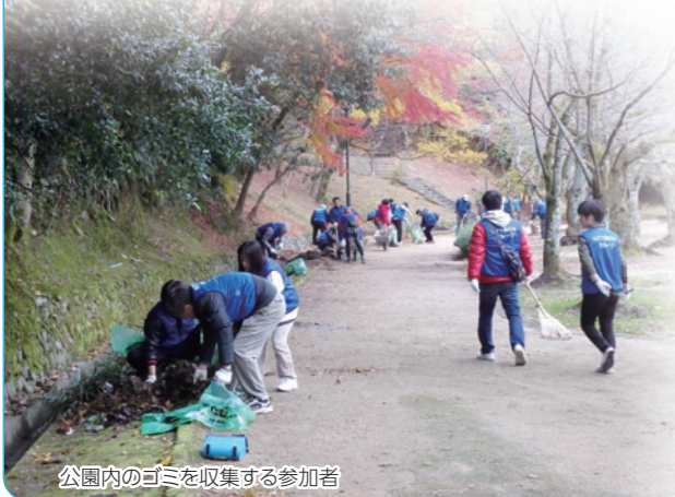
公園内のゴミを収集する参加者

また、公園事務所（愛媛県）、松山市などから清掃道具の提供やゴミ処理の協力をいただくなど、町ぐるみの取り組みとして定着しています。今後も地域社会貢献活動の一環として取り組んでいきます。