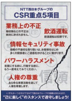
NTT西日本グループの「CSR重点5項目」ポスター

「業務上の不正」「飲酒運転」「情報セキュリティ事故」「パワーハラスメント」の根絶、「人権の尊重」