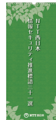
「NTT西日本 情報セキュリティ推進標語三十一選」の表紙

応募総数47,000点の作品の中から代表31作品について日めくりカレンダー「NTT西日本 情報セキュリティ推進標語三十一選」(写真右)を作成し、情報セキュリティ遵守に向けた職場などでの啓発活動に取り組んでいます。