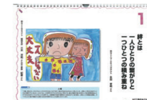
「人権啓発日めくりカレンダー」の1ページ

なお2013年度は、ポスター214作品、標語73,777作品の応募がありました。