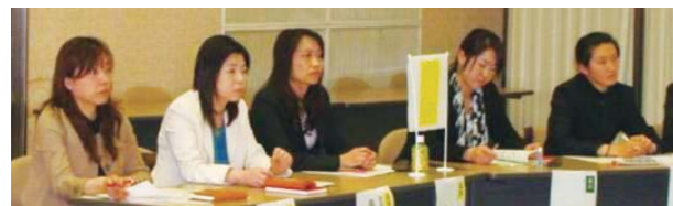
女性社員を対象とした研修模様

また、女性ならではの視点で、働く環境の改善やダイバーシティに関する啓発セミナーなどを実施するワーキンググループ活動も行なっています。