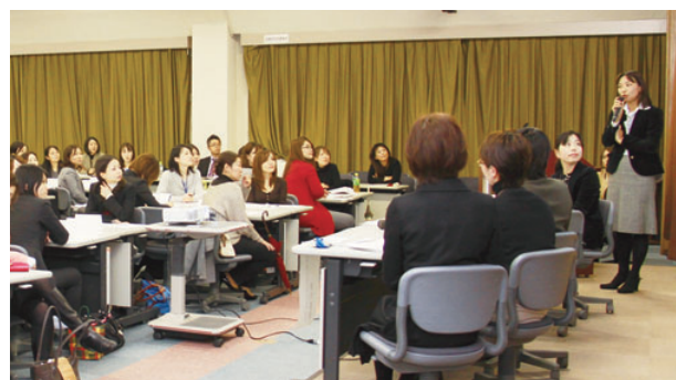
「仕事と育児を両立しながらリーダーとして活躍する女性たち」と題した、対話会の模様

また、女性が自主的に女性ならではの視点で業務を積極的に改善していけるよう提案を進めていく、ワーキンググループ活動も行なっています。