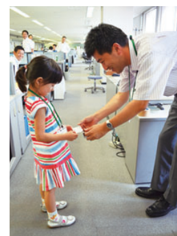
名刺交換体験の様

子どもたちの夏休み期間中である2011年8月、NTT西日本本社ビルにてファミリーデーを開催しました。男性の育児参画、ワーク・ライフ・バランス推進の観点から、NTT西日本本社社員を対象に、社員の家族を会社に招待し、職場見学、食堂での昼食体験、NGNサービスオペレーションセンター見学などを実施しました。職場見学のカリキュラムにおい