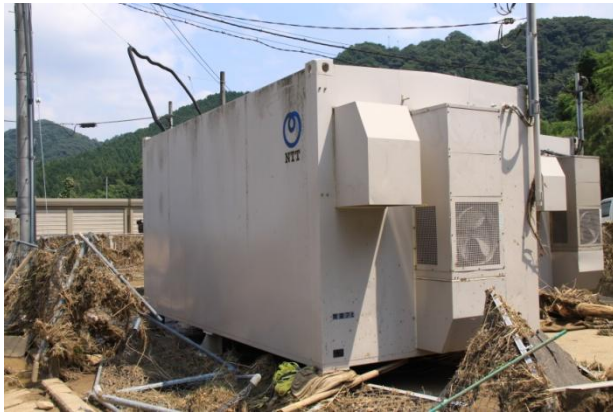
水没した小川電話交換所