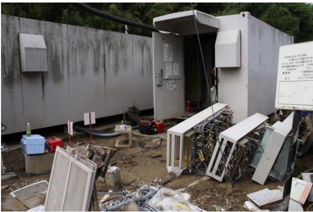
水没した交換所で撤去した機器