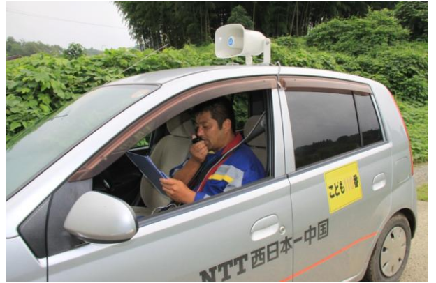
広報活動を行う社員 (山口市阿東嘉年地区)