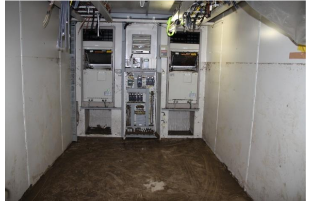
小川電話交換所内(通信設備撤去後)