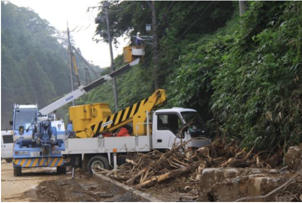
土砂崩れ現場で復旧作業を行う作業員 (山口市阿東嘉年地区)