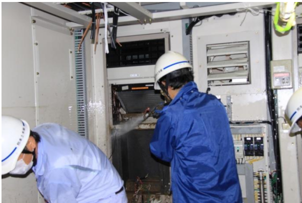
水没した小川電話交換所での洗浄作業