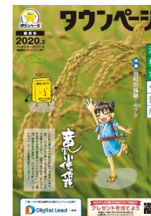
浜松市中区版 (浜松市東区版、浜松市西区版、浜松市南区版、浜松市北区版、浜松市浜北区・天竜区版も表紙デザインは同様)