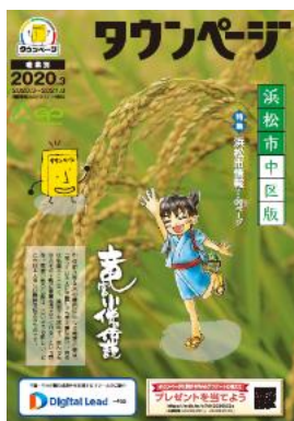
浜松市中区版タウンページ