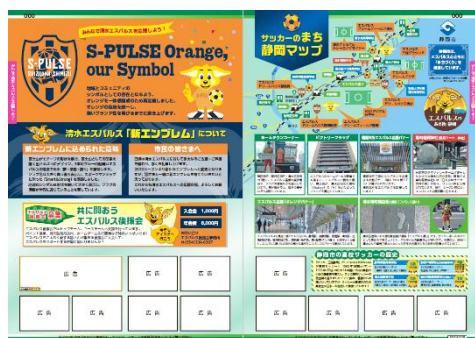
静岡市清水区版「みんなで清水エスパルスを応援しよう！」

静岡市と清水エスパルスのコラボ企画である「みんなで清水エスパルスを応援しよう！」や行政機関と連携した「浜松市情報」など、該当エリアの方に伝えたい情報をまとめた「地域特集」を掲載。また、知っておくと便利なことや暮らしの中で起こるさまざまなトラブルや困りごとをまとめた「生活情報特集」も引き続き掲載します。