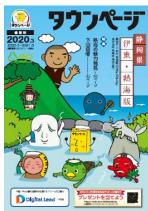
静岡県伊東・熱海版 (伊東市版も表紙デザインは同様)