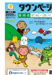
静岡県磐田・掛川版 (磐田市版も表紙デザインは同様)