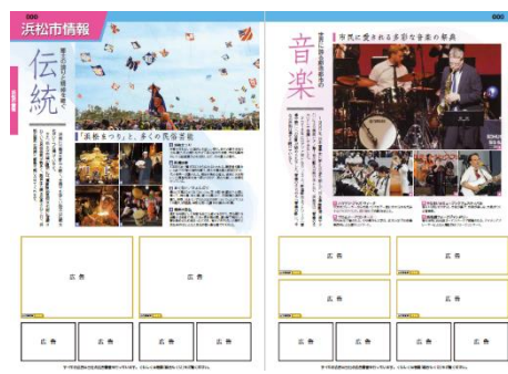
浜松市各区版、湖西市版「浜松市情報」