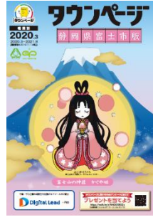
静岡県富士市版 (富士宮市版も表紙デザインは同様)