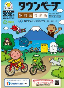
静岡県沼津版 (沼津市版、三島市版、御殿場市版、裾野市版も表紙デザインは同様)

各エリアの伝説や地域キャラクター、名所等を題材として親しみをもってもらえるものとし、多くの県民の皆さまに手に取っていただけるように企画・編集しました。