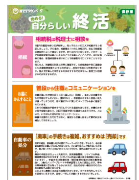
「終活チラシ」浜松市版