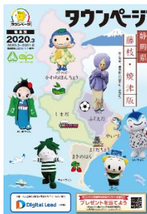
静岡県藤枝・焼津版 (藤枝市版、焼津市版、島田市版も表紙デザインは同様)