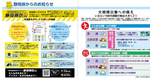
静岡県からのお知らせ