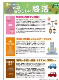
「終活チラシ」浜松市版