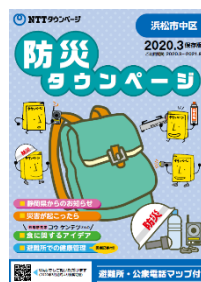
別冊「防災タウンページ」