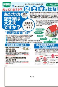
「空き家対策チラシ」富士市版