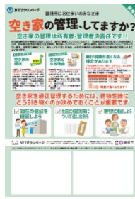
「空き家対策チラシ」藤枝市版