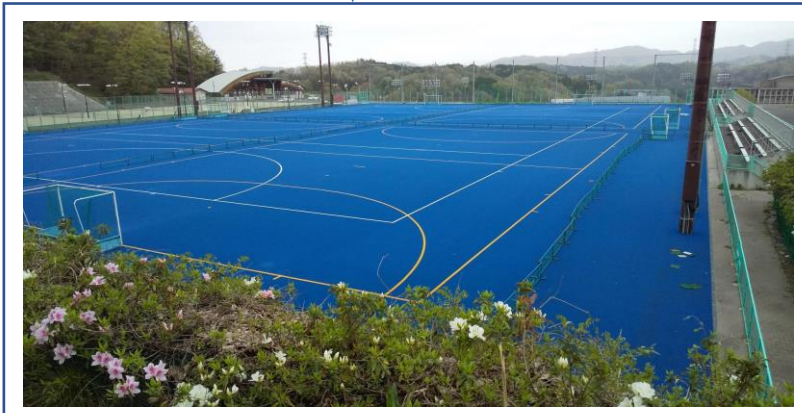
三成公園ホッケー場