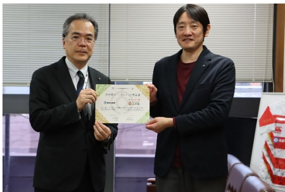
「大分県パートナーシップ宣言書贈呈模様」（3月28日撮影）

今後も、NTT西日本 大分支店は大分県と連携して、転職なき移住促進による地方創生を進めていくため、相互に協力し取り組んでまいります。