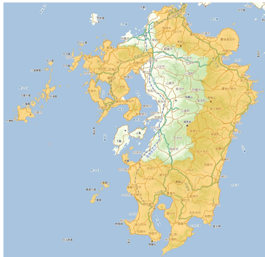
国土交通省 国土地理院, Copyright © NTT InfraNet. All Rights Reserved.