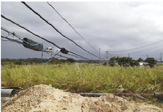
※ケーブルの垂れ下がり（喜界島）10/29