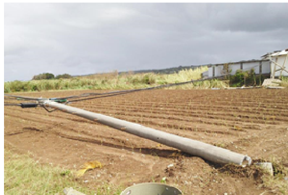
※電柱の折損（喜界島）10/29