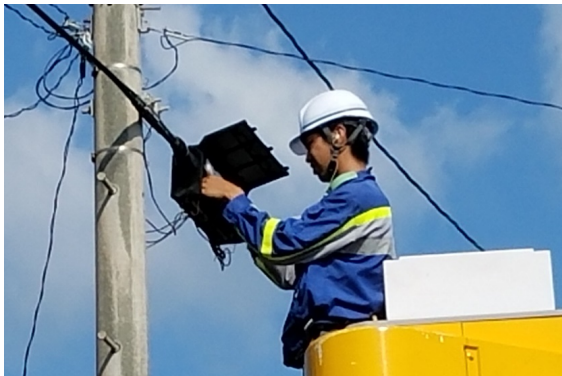
※一軒一軒の故障修理①（屋久島町）