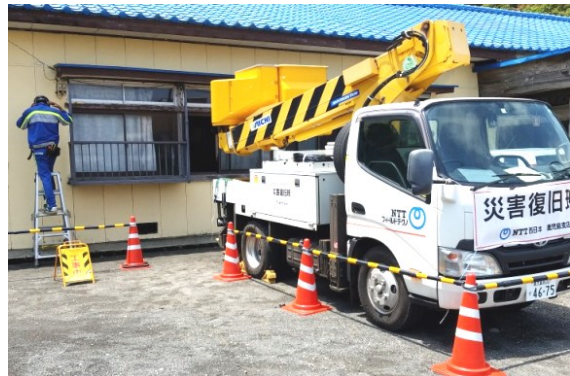
※一軒一軒の故障修理②（屋久島町）